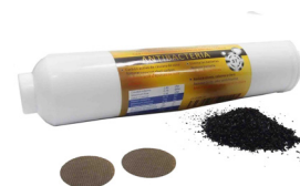
Postfiltro GAC Antibacterias